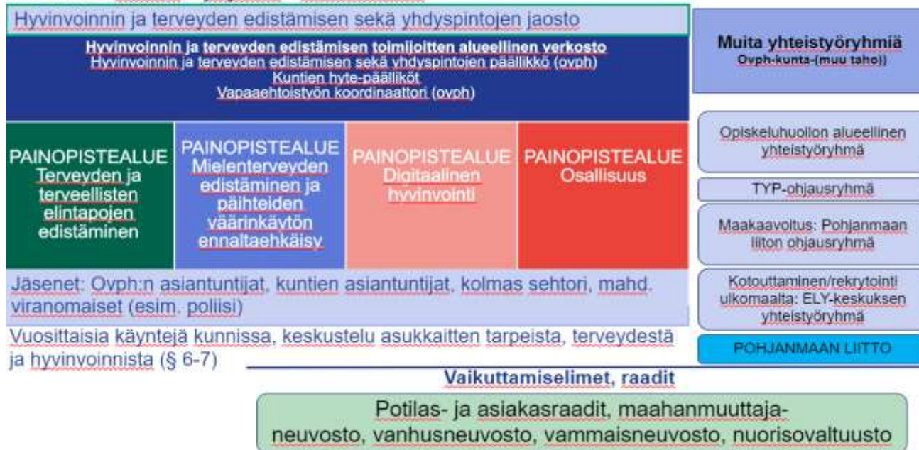
Kuvio 1: Yhteistyörakenteet terveyden ja hyvinvoinnin edistämiseen Pohjanmaan hyvinvointialueella

OVPH – kunnat – järjestöt - viranomaiset