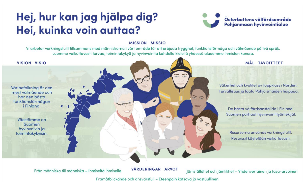
Kuvio 1. Pohjanmaan hyvinvointialueen strategia

Hyvinvointialueen aluevaltuusto on hyväksynyt 12.9.2022 ensimmäisen hyvinvointialuetta koskevan strategian seuraavalla visiolla: "Väestömme on Suomen hyvinvoivin ja toimintakykyisin." Tavoitteenamme on, että palveluidemme turvallisuus ja laatu ovat Pohjoismaiden huippua, ja että meillä on Suomen parhaimmat hyvinvointityöntekijät ja käytämme resurssejamme vaikuttavasti.