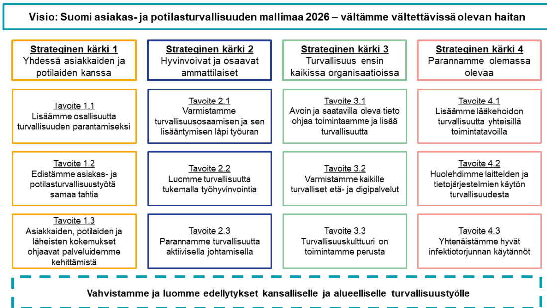
Kuvio 4. Asiakas- ja potilasturvallisuus strategia ja toimeenpanosuunnitelma 2022–2026 (STM 2022).

Valvontatietoja ja -havaintoja seurataan säännöllisesti laadun ja valvonnan yksikön osa-vuosiraportoinnin myötä. Osa-vuosiraportit esitetään kolme kertaa vuodessa toiminnalliselle johtoryhmälle. Valvontatiedoista ja -havainnoista koostetaan kerran vuodessa valvontaraportti. Valvontaraportti julkaistaan hyvinvointialueen verkkosivuilla ( https://pohjanmaanhyvinvointi.fi ).