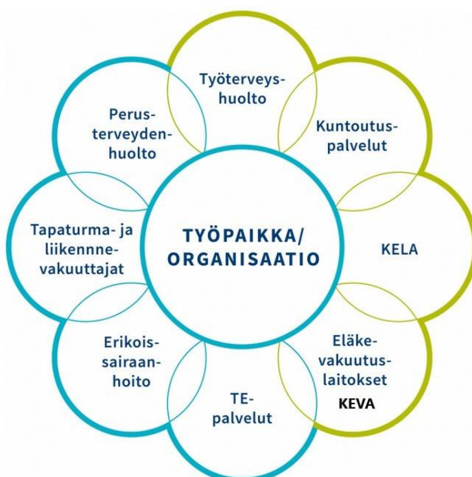
Kuva 2. Työpaikan/organisaation työkykyjohtamisen tärkeimmät yhteistyökumppanit

Kun johtamistyössä etsitään erilaisia ratkaisuja henkilöstön työkyvyn tukemiseen, se tapahtuu usein yhteistyössä eri toimijoiden kanssa. Tämä koskee sekä organisaatio- että esihenkilötasoa.