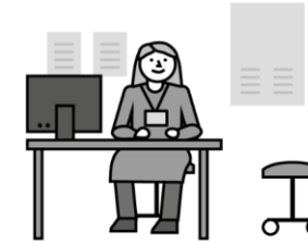
Palvelutarpeen arviointi Bedömning av servicebehovet

Palvelutarpeen arviointi tarvittaessa jo jakson aikana Bedömning av servicebehovet v.b. redan under rehab.perioden