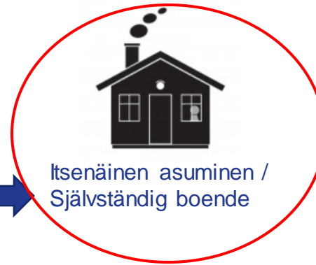
Itsenäinen asuminen / Självständig boende