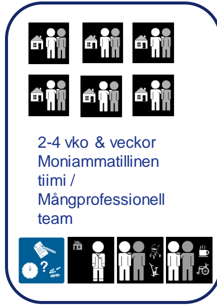
Tehostettu kotikuntoutus, tavoitteena itsenäinen arki Effektiverad hemrehabilitering, som mål självständig vardag

Lähihoitaja ma-su/ Närvårdare må-sö Sairaanhoitaja ma-su / Sjukvårdare må-sö Lääkäri / Läkare