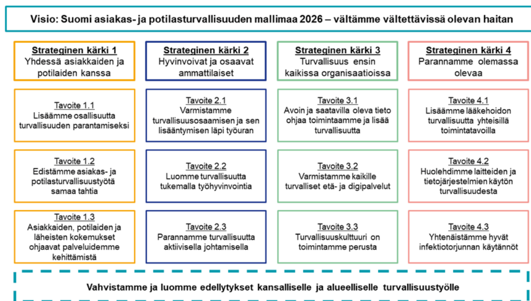
Kuva 5. Asiakas- ja potilasturvallisuus strategia ja toimeenpanosuunnitelma 2022–2026 (STM 2022).

Valvontasuunnitelman laadinnasta, toteutuksesta ja raportoinnista vastaa valvonnan päällikkö. Valvontasuunnitelman valmistelee omavalvonnan ohjausryhmä. Valvontasuunnitelman hyväksyy hyvinvointialueen johtoryhmä, ja se viedään aluehallitukselle tiedoksi. Hyvinvointialueen valvontasuunnitelma päivitetään vuosittain Sosiaali- ja terveydenhuollon valtakunnallisen valvontaohjelman ja Pohjanmaan hyvinvointialueen kullekin vuodelle valitsemien painopistealueiden ohjaamina. Valvontatyön suunnittelussa ja toteutuksessa huomioidaan myös Sosiaali- ja terveysministeriön vuosille 2022–2026 laatiman Asiakas- ja potilasturvallisuusstrategia , ja sen toimeenpanosuunnitelman tavoitteet (kuva 5).