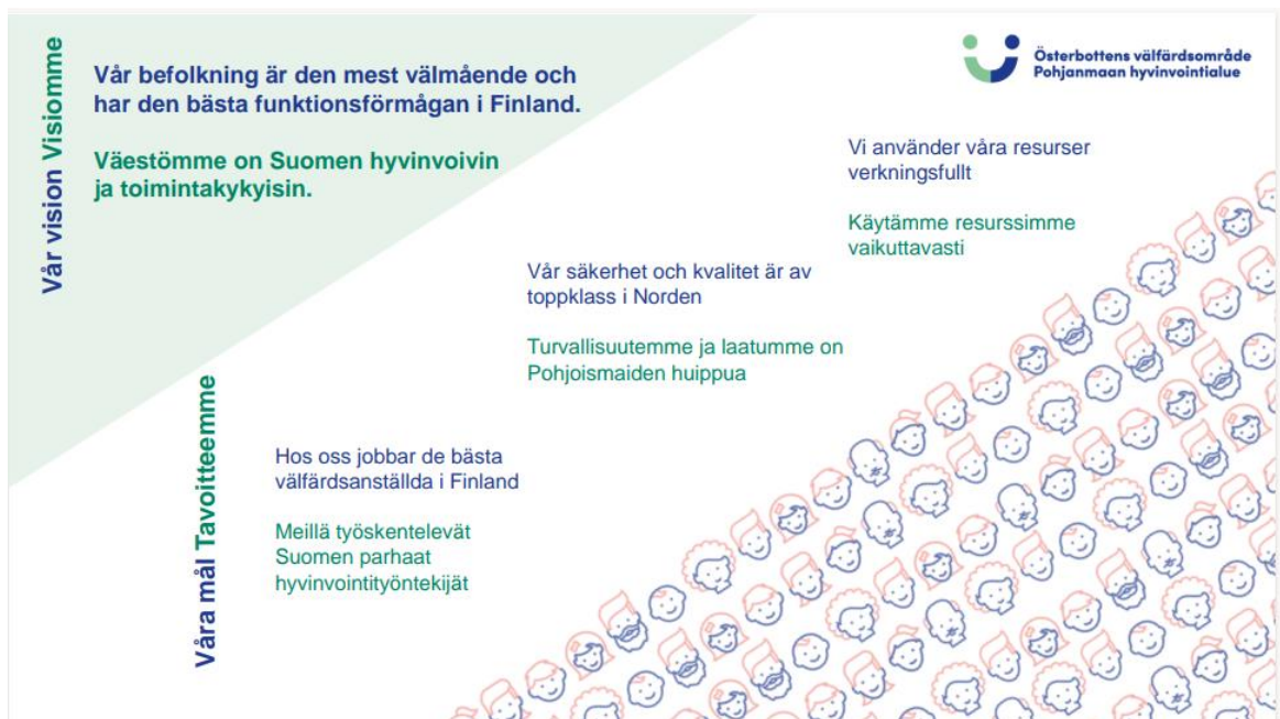
Kuva 1. Pohjanmaan hyvinvointialuestrategia 2023–2026.