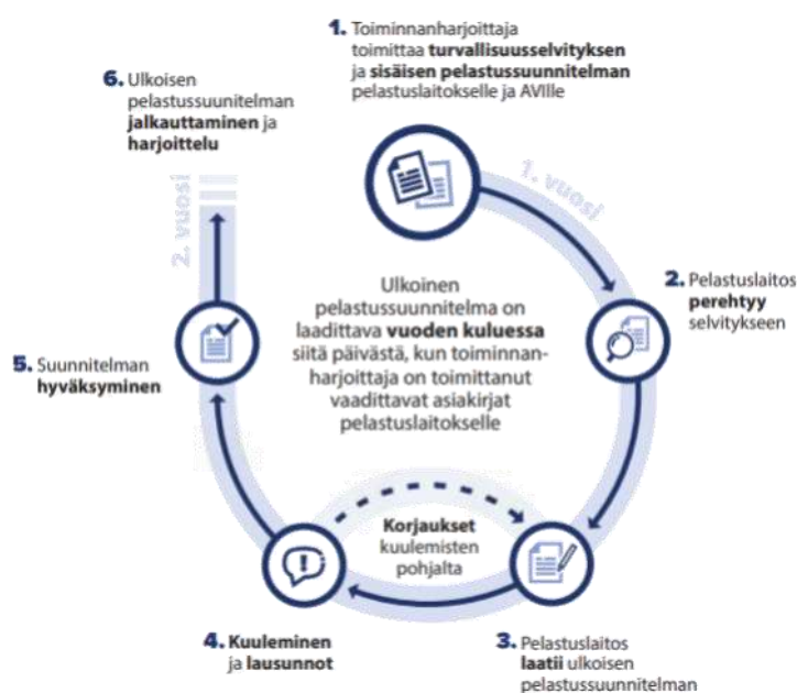
Kuva 2. Kaavio ulkoisen pelastussuunnitelman laadintaprosessista.

Suunnitteluun, tiedottamiseen ja harjoitteluun liittyvät määräajat on annettu asetuksessa (SM:n asetus ulkoisista pelastussuunnitelmista, 1286/2019).