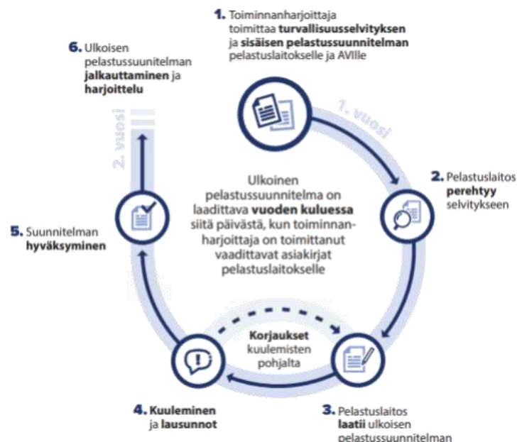
Bild 1. Schema över processen för utarbetandet av en extern räddningsplan.

Tidsfrister för planering, information och övningar har fastställts i förordningen. (IM:s förordning om externa räddningsplaner 1286/2019).