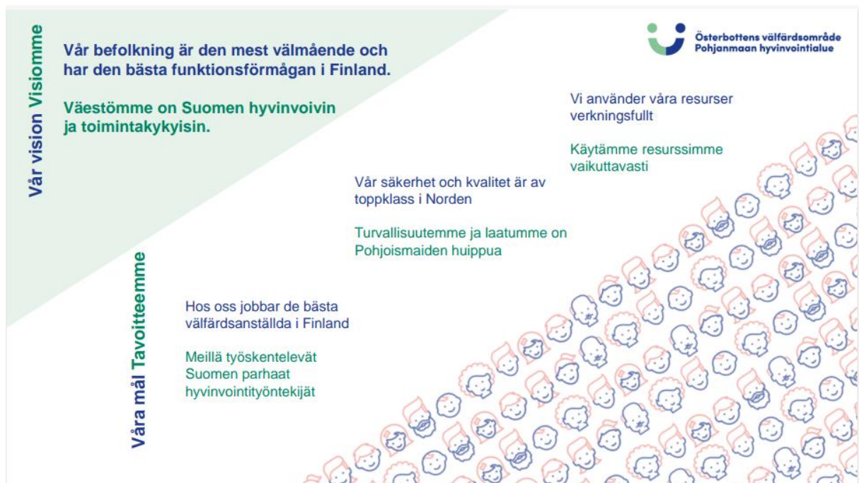
Kuva 1. Pohjanmaan hyvinvointialueen strategia

Hyvinvointialueen aluevaltuusto on hyväksynyt 12.9.2022 ensimmäisen hyvinvointialuetta koskevan strategian seuraavalla visiolla: "Väestömme on Suomen hyvinvoivin ja toimintakykyisin." Tavoitteenamme on, että palveluidemme turvallisuus ja laatu ovat Pohjoismaiden huippua, ja että meillä on Suomen parhaimmat hyvinvointityöntekijät ja käytämme resurssejamme vaikuttavasti.