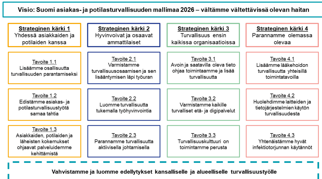
Kuvio 4. Asiakas- ja potilasturvallisuus strategia ja toimeenpanosuunnitelma 2022–2026 (STM 2022).

Valvontatyön suunnittelussa ja toteutuksessa huomioidaan myös Sosiaali- ja terveysministeriön vuosille 2022-2026 laadittu Asiakas- ja potilasturvaylikunnallisuusstrategian ja toimeenpanosuunnitelma .